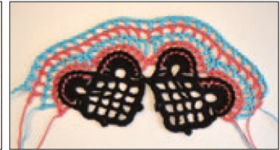
Krs 4 valmis.