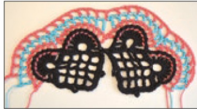
Krs 3 valmis.

Krs 2: Nyt koukku normaalisti, ts. mol. silmukanreunojen läpi.