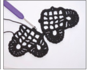
2. sydän: Virkataan yhteen krs:lla 6